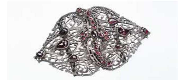
Gürtelschnalle Silber mit Böhmisches Granaten