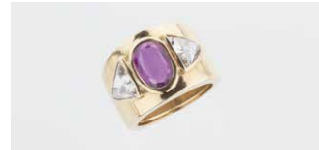
Ring Gold (13,40 gr. ), ein Rubin 2 Karat, zwei Diamanten dreieckig je ca. 1 Karat