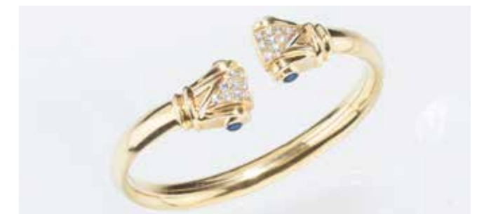
Armreif Gold (24,40 gr.), Brillanten und Blauquarze