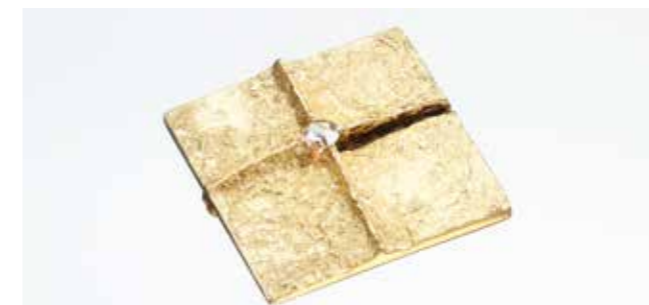
Anton Frühauf Anhängers/Brosche 60er Jahre Gold (12,50 gr.), ein zentraler Diamant, Rosenschliff (circa 0,10 Karat), Juweliermarke